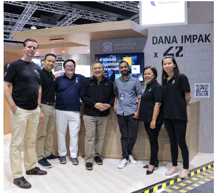
► Kakitangan utama Khazanah dan 42 Malaysia (42MY) di Pameran Pemerkasaan Belia 2023 (YEF2023)

Pada tahun 2022, projek-projek baharu bernilai RM500 juta dikenal pasti untuk memberikan manfaat sosioekonomi kepada rakyat Malaysia, merangkumi pelbagai bidang-bidang yang membawa impak termasuklah peningkatan kemahiran digital, menggalakkan pelaburan dalam syarikat usahawan tempatan serta ekosistem modal teroka dan sektor agrimakanan. Pelbagai inisiatif yang kami perkenalkan adalah bertujuan menyokong ekosistem pemula ( start-up ) tempatan yang terdiri daripada usahawan, syarikat-syarikat pemula, modal teroka dan program usaha niaga korporat di bawah Future Malaysia Programme , yang melibatkan kerjasama dengan rakan kongsi domestik dan antarabangsa.