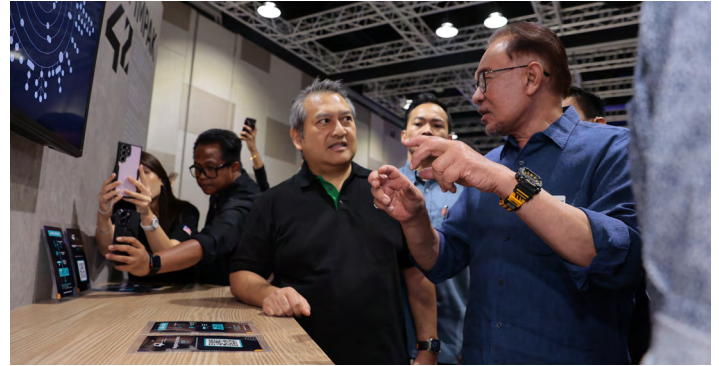
► Dato' Seri Anwar Ibrahim dan Dato' Feisal di Forum dan Eksposisi Pemerksaan Anak Muda 2023 (YEF2023) di Kuala Lumpur