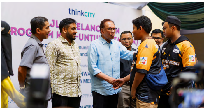
► Dato' Seri Anwar Ibrahim, Datuk Seri Aminudin Shari, Menteri Besar Selangor dan Hamdan Majeed, Pengarah Urusan Think City beramah mesra dengan wakil belia dari PPR Kg Hicom, Shah Alam semasa pelancaran Kita-Untuk-Kita (Program K2K) pada 8 April 2023

Penggemblengan tenaga antara Khazanah dan GLIC serta GLC yang lain adalah penting untuk mewujudkan Malaysia sebagai sebuah negara yang berdaya saing di peringkat global, mampu mencapai sasaran pertumbuhannya dan sebagai destinasi pelaburan yang menarik bagi pelabur asing.