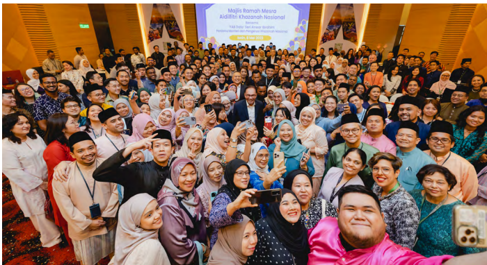
► Dato' Seri Anwar Ibrahim menghadiri majlis Aidilfitri bersama-sama warga kerja dan Ahli Lembaga Pengarah Khazanah

Perasaan bangga lahir berikutan tumpuan yang diberikan terhadap saluran-saluran bersifat jangka panjang dan berasaskan komuniti seperti Yayasan Hasanah, yang sehingga kini telah menyantuni 2.4 juta orang melalui program-program yang telah dilaksanakan. Begitu juga dengan usaha sama Khazanah bersama Sunway Education Group melalui 42 Malaysia, sebuah sekolah sains computer rakan setara (P2P) yang inovatif bagi memacu peningkatan kemahiran digital untuk rakyat mencakupi semua peringkat umur, dan peruntukan RM150 juta untuk projek-projek kredit karbon berdasarkan alam semula jadi. Inisiatif-inisiatif ini adalah ke arah pembinaan Malaysia yang lebih maju, dan peranan Khazanah sebagai pemacu pembangunan negara.