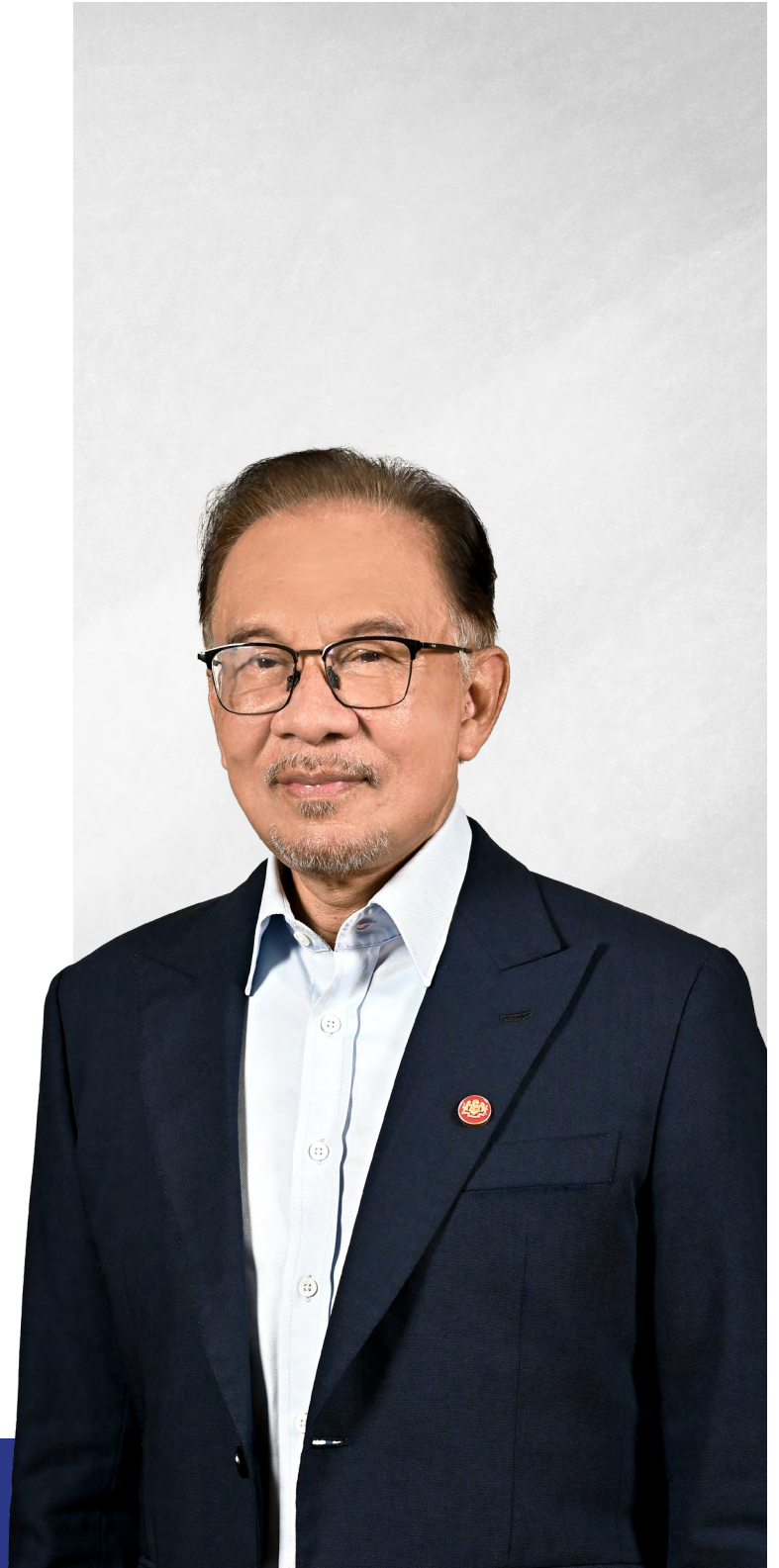
Dato' Seri Anwar Ibrahim

Sebagai dana kekayaan berdaulat negara, Khazanah berada di kedudukan yang betul untuk memainkan peranan utama dalam mencapai aspirasi ini. Melalui pelaburan bersasar dalam syarikat-syarikat juara nasional dan permulaan, merentasi sektor-sektor utama dan membangun, Khazanah menyokong pemulihan berterusan negara dan menyediakan asas untuk masa depan yang lebih kukuh dan mampan.