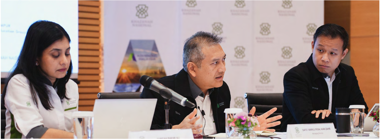
► Taklimat media Ulasan Tahunan Khazanah 2023 (KAR2023)

Portfolio Dana Impak menyasarkan penciptaan impak sosial yang berpanjangan dengan tumpuan menyeluruh terhadap kemampuan dan kesinambungan usaha Program Transformasi GLC (GLCT) yang bermula pada tahun 2005, yang berkembang kepada peluang-peluang pelaburan bertemakan kemampuan dan yang terkini, peranan utama kami dalam memacu ESG merentasi landskap korporat Malaysia. Pada tahun 2022, kami melancarkan penyata Jangkaan Pemegang Saham dan Kepengurusan Pelaburan yang memperincikan enam teras jangkaan syarikatsyarikat portfolio kami, termasuk menerapkan amalan perniagaan yang mampan.