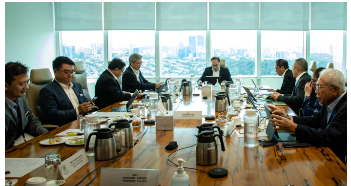
► Dato' Seri Anwar Ibrahim memimpin Mesyuarat Lembaga Pengarah Khazanah, Mei 2023