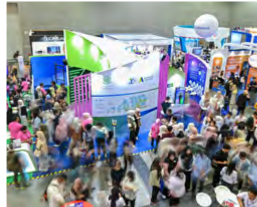
► Reruai pameran K-Youth semasa berlangsungnya Graduan Aspire 2024.

Untuk mengetahui lebih lanjut tentang FMS, sila rujuk Bab 4 Mengoptimumkan Portfolio Kami Demi Pertumbuhan Mampun – Portfolio Dana Impak pada halaman 54 dalam laporan ini.