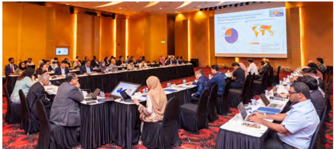
► Pada 15 September 2023, KRI dan Kementerian Kewangan (MOF) bersama-sama menganjurkan perbincangan kumpulan fokus dalam menangani keterjaminan makanan di Malaysia bagi Belanjawan 2024. Sesi tersebut dihadiri oleh agensi kerajaan, pihak berkuasa kawal selia, badan pemikir, perusahaan swasta, institusi pendidikan, dan persatuan peladang.