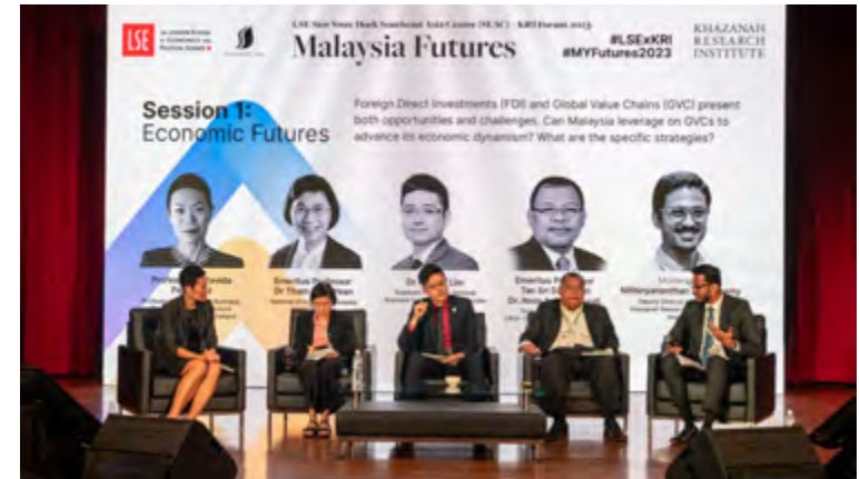
► Forum Malaysia Futures, anjuran bersama KRI dan LSE Saw Swee Hock Southeast Asia Centre pada 31 Mei dan 1 Jun 2023, menghimpunkan lebih 300 cendekiawan terkemuka, penggubal dasar, badan pemikir, pemimpin berkepakaran dan penyelidik muda – yang hadir secara peribadi dan secara maya - untuk terlibat dalam wacana yang amat menarik dalam membayangkan kemungkinan tentang “masa depan Malaysia”.