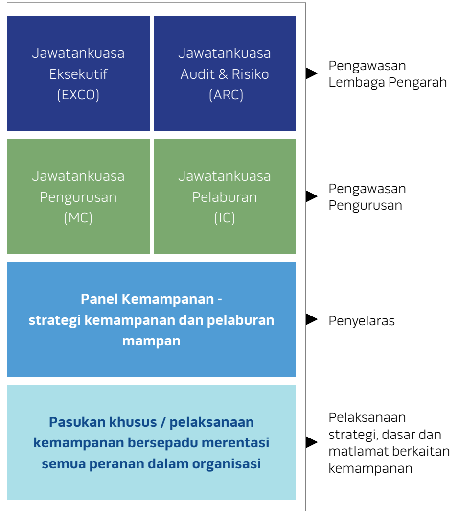
Struktur Tadbir Urus Kemampanan Kami

Untuk menterjemahkan rangka kerja kami kepada strategi kemampanan yang boleh dilaksanakan, kami menubuhkan Panel Kemampanan yang terdiri daripada wakil-wakil daripada Pasukan Kemampanan Pusat (di bawah Bahagian Strategi kami), Pasukan Pelaburan Mampan (SI) (di bawah Bahagian Pelaburan kami) dan wakil daripada bahagian-bahagian sokongan lain. Dalam membangunkan strategi kemampanan, Panel Kemampanan mempertimbangkan potensi impak strategi tersebut terhadap Khazanah. Sementara itu, wakil-wakil khusus projek bertanggungjawab untuk pelaksanaan di lapangan, merentas pasukan dan bahagian masing-masing.