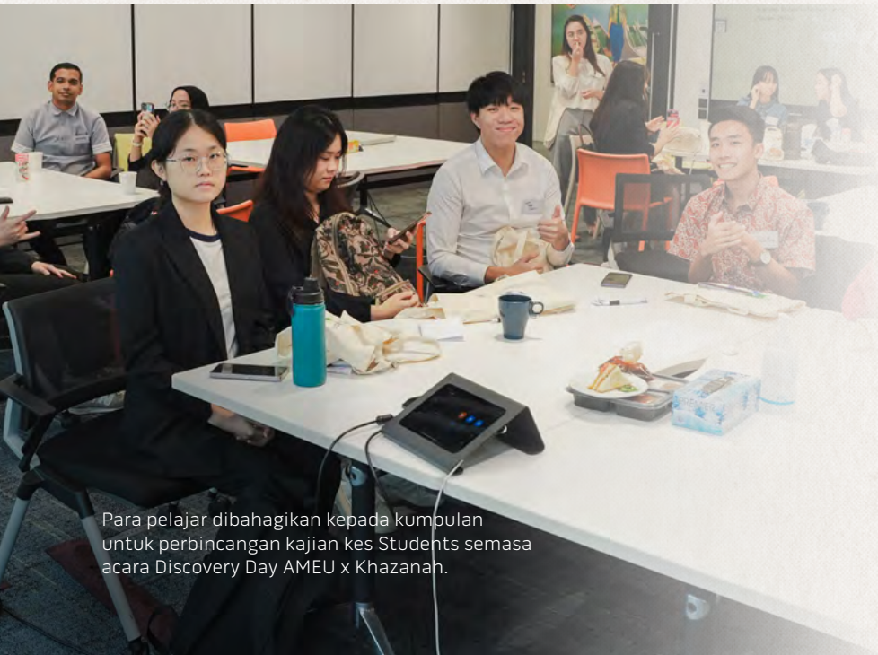
Para pelajar dibahagikan kepada kumpulan untuk perbincangan kajian kes Students semasa acara Discovery Day AMEU x Khazanah.

53 pelajar prauniversiti dan lepasan ijazah menyertai acara ini yang memaparkan pengenalan kepada Khazanah dan Program Pelatih Siswazah, sesi panel mengenai kesediaan kerjaya dan pertandingan kajian kes berpusatkan ESG.