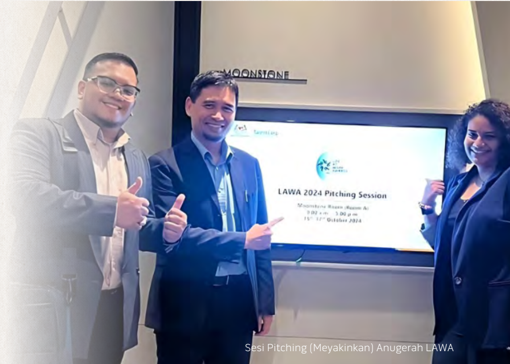
Sesi Pitching (Meyakinkan) Anugerah LAWA

Pada tahun 2024, Khazanah dinobatkan naib johan bagi Kategori Graduan Muda sebagai penghargaan terhadap usaha berterusan kami untuk memupuk bakat baru muncul dan menggalakkan tempat kerja yang memperkasakan ahli profesional muda untuk bangkit, berkembang maju dan meninggalkan kesan. Anugerah ini mencerminkan dedikasi kami untuk memupuk budaya mendahulukan insan yang menyokong pembangunan dan aspirasi generasi baharu.