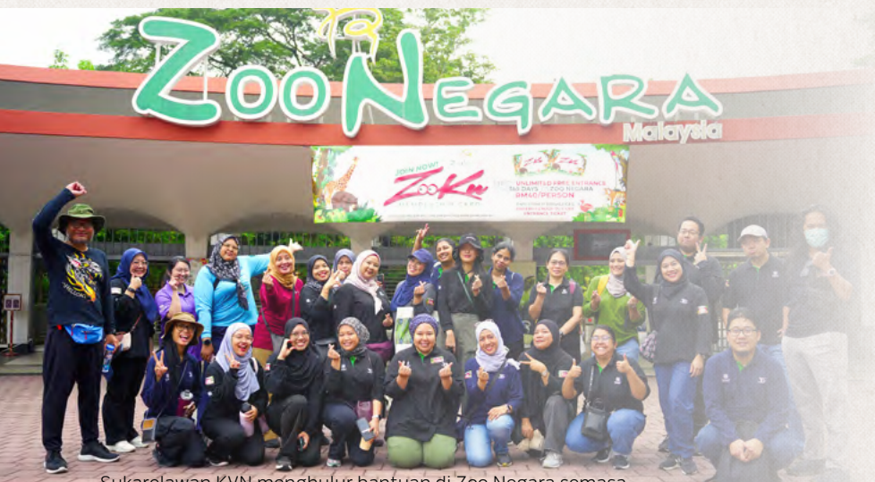
Sukarelawan KVN menghulur bantuan di Zoo Negara semasa mempromosikan kesejahteraan mental dan kegembiraan membalas budi.

Menganjurkan lapan program libat urus, termasuk pelbagai aktiviti jangkauan dan alam sekitar. Kami juga mengadakan kempen derma darah yang melibatkan penyertaan 54 orang warga kerja.