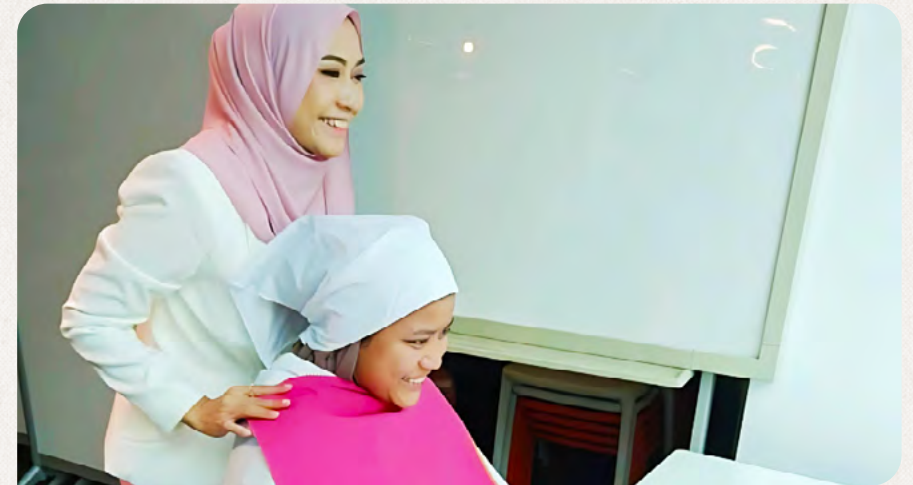
Salah seorang kakitangan menyertai bengkel analisis warna peribadi semasa Minggu KITAWellbeing 2024.

Dedikasi kami kepada DEI diiktiraf pada majlis Anugerah Life at Work Awards (LAWA) yang membuktikan usaha berterusan kami untuk memupuk budaya yang memperjuangkan kesejahteraan dan keterangkuman.