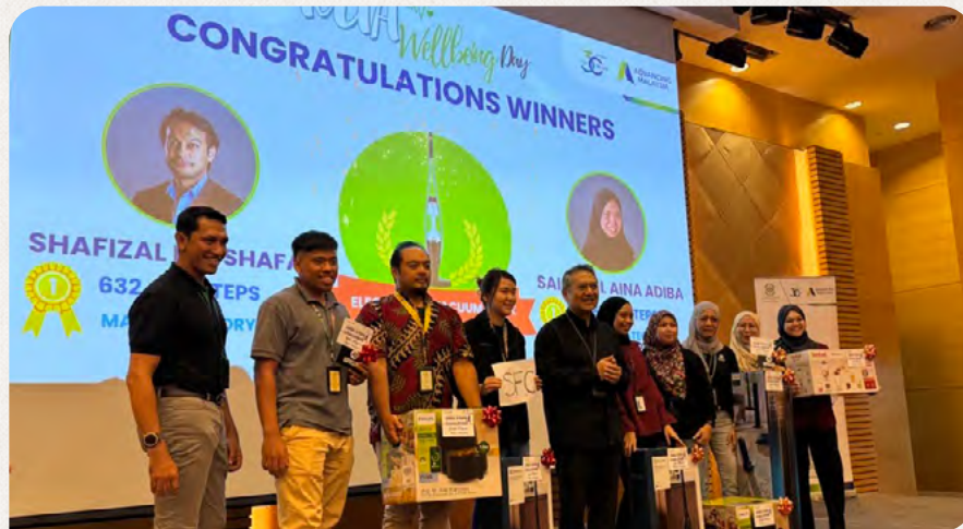
Pemenang Cabaran Melangkah ke Ulang Tahun ke-30 Anniversary menerima hadiah mereka semasa sambutan Hari KITAWellbeing 2024.

Semasa sambutan Hari KITAWellbeing, lebih 30 vendor penjagaan diri dan kesihatan menyediakan pelbagai alat dan sumber untuk menyokong kesejahteraan warga kerja.