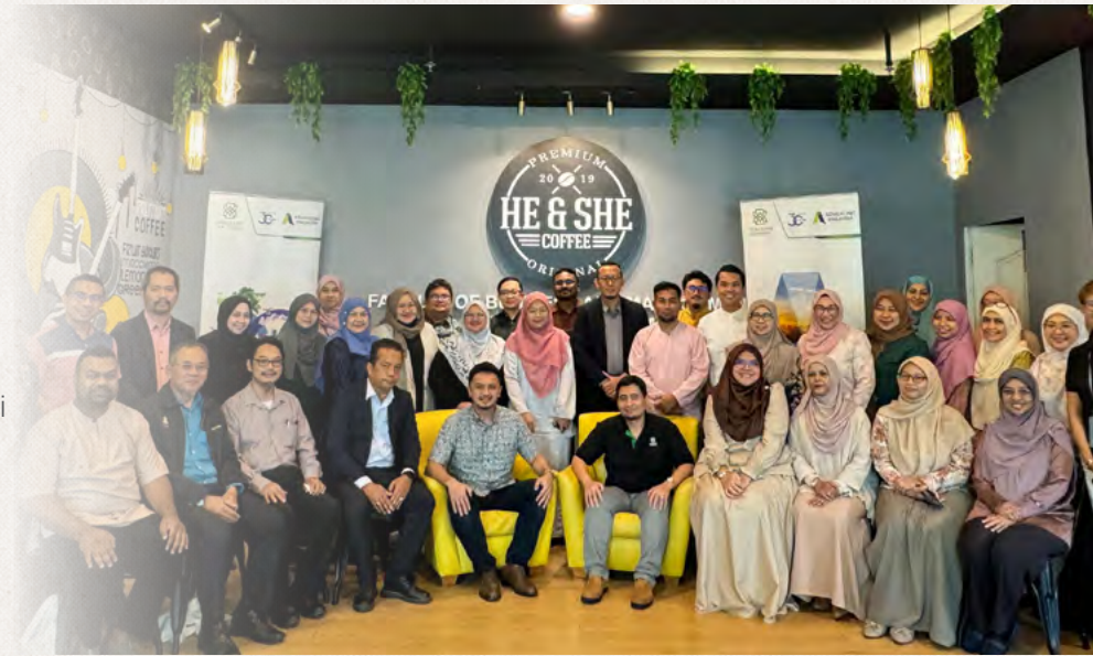
Super Tuesday di UiTM Puncak Alam.