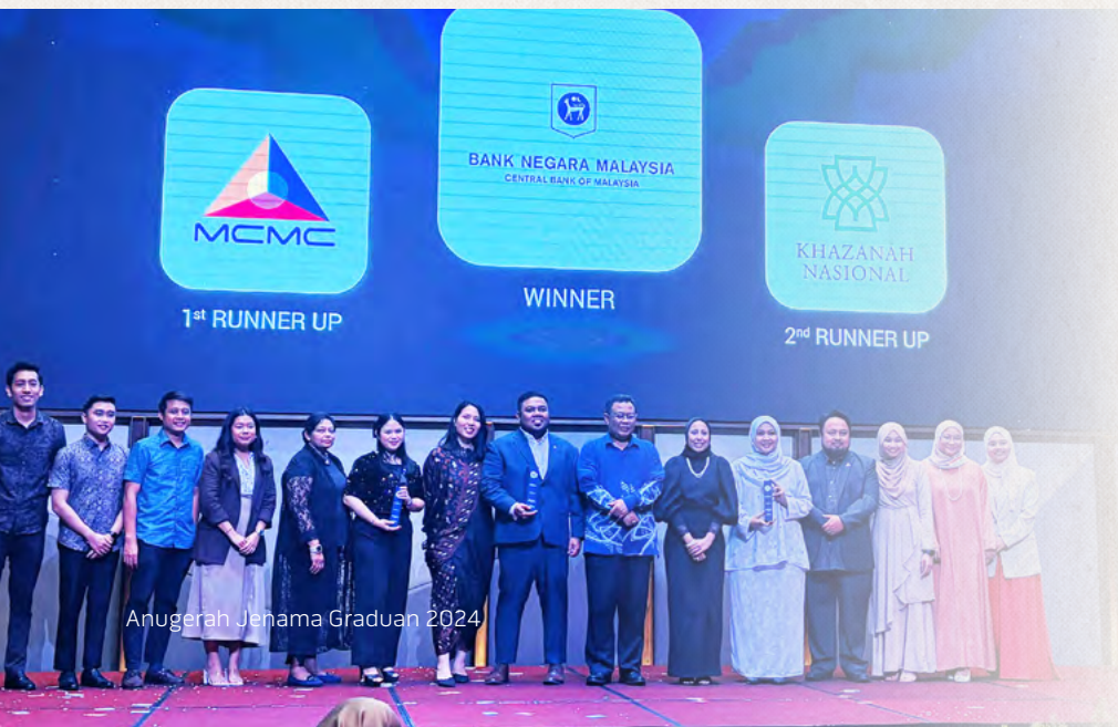
Anugerah Jenama Graduan 2024

Bagi anugerah pada tahun 2024, Khazanah meraih tempat ketiga kategori Kerajaan Majikan Paling Disukai di Malaysia dan juga diiktiraf sebagai satu daripada 20 Majikan Paling Disukai di seluruh negara. Pengiktirafan ini menggariskan kekuatan jenama majikan Khazanah dan reputasi kami yang semakin meningkat sebagai majikan pilihan dalam kalangan bakat berkaliber tinggi.